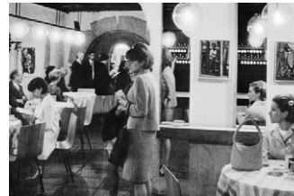
Blick in das belebte Foyer nach dem Umbau von 1963/64.

Die ersten Ideen zu einem städtischen Jugendhaus konkretisieren sich 1960. Die Stadt beginnt sich für Jugendbelange zu engagieren. Das Haldenfest im Herbst 1962 und das Jugendfest im Sommer 1963 bringen willkommenen Zustupf. Noch während der letzten Spielzeit des Cabaret Rüeblihaft beginnen 1962 die ersten Umbauten unter Beteiligung von Jugendlichen. 1963/64 schliesslich wird das Kornhaus unter der Leitung von Adi Meyer für die neuen Zwecke hergerichtet. Das Kellertheater wird dabei ebenfalls saniert und die Einbauten an der Treppe, im Foyer und der Cafeteria ausgeführt, wie sie heute noch bestehen. Das Jugendhaus öffnet schliesslich am 21. August 1965 offiziell seine Türen. Noch in den 60er-Jahren beginnt Josef Tremp mit dem Aufbau einer städtischen Kunstgalerie im Obergeschoss. Die Aufbruchstimmung der 60er-Jahre bringt auch wieder Leben in den Theaterraum. Nach dreijährigem Interregnum wird ab dem Winter 1966/67 im Kornhauskeller wieder professionell Theater gespielt. Der Germanist und Kantonsschullehrer Anton